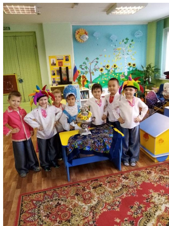
Тематическое занятие «Что, Где, Когда?», посвященное Дню защитника Отечества